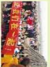
卓达学校家长代表与小壁林小朋友共同参与植树造林活动。