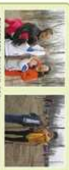
卓达学校家长代表与小壁林小朋友共同参与植树造林活动。