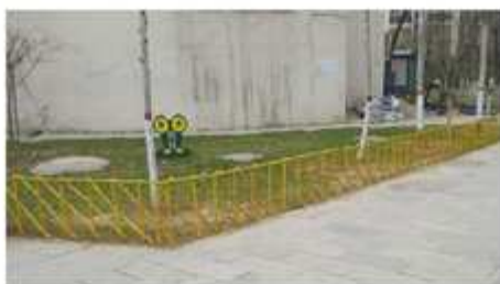
■ 景观带风景。

本报讯(冀鲁豫 冯涛)在物管中心中心广场的美草景观带一侧,最近出现了一道亮丽的风景线。这道风景线是由物业巧手将废弃的树枝加工而成的“篱笆墙”。