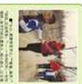
卓达学校家长代表与小壁林小朋友共同参与植树造林活动。