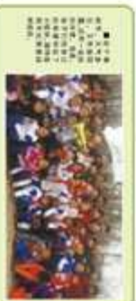
卓达学校家长代表与小壁林小朋友共同参与植树造林活动。