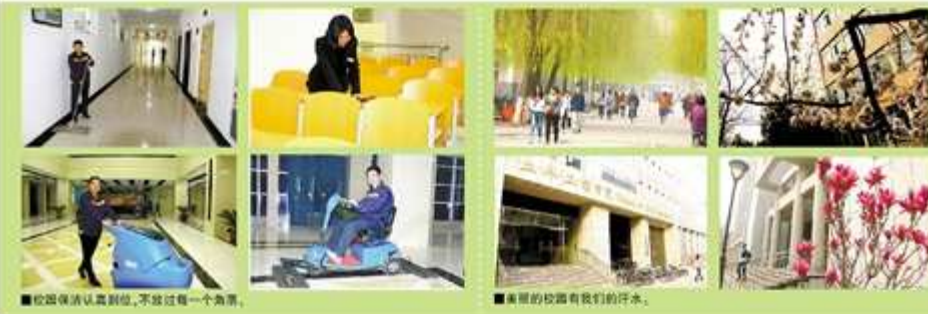
校园保洁认真到位,不放过每一个角落。