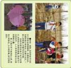
卓达学校家长代表与小壁林小朋友共同参与植树造林活动。