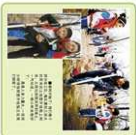
卓达学校家长代表与小壁林小朋友共同参与植树造林活动。