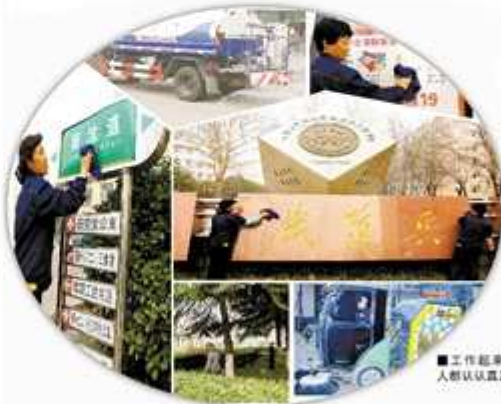
工作起来每个人都认真负责。

卓达物业保洁部于石家庄卓达二院北心河北岸,2014年,卓达物业接管了卓达物业保洁部,先后:1.启动教学区生活区保洁,2.启动图书馆保洁及图书馆生活区保洁,3.启动图书馆教学区生活区保洁,4.启动图书馆生活区保洁,5.启动图书馆生活区保洁。